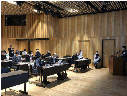
登録団体プレゼンテーションの様子