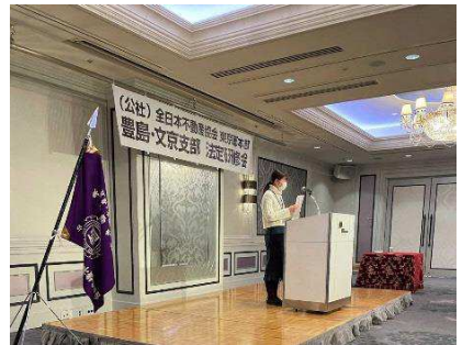
全日本不動産協会豊島文京支部法定研修会にてとしま居住支援バンクの説明の様子

宅地建物取引業協会豊島区支部役員会（令和4年7月22日）、全日本不動産協会第四ブロック合同不動産情報交換会（令和4年8月25日）にて、「としま居住支援バンク」の周知をし、登録方法について意見をいただいた。また、豊島区住宅課と連携し、全日本不動産協会豊島文京支部法定研修会（令和5年1月18日）にて、「としま居住支援バンク」の紹介と登録方法や「セーフティネット住宅」制度の説明をしている。