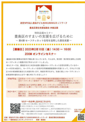
第4回特別企画セミナー オンラインセミナー チラシ