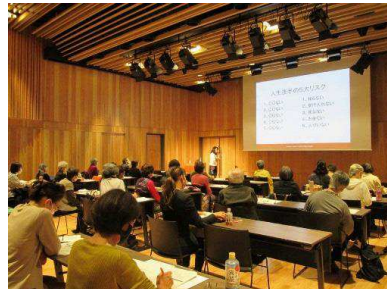
としま居住支援セミナーの様子