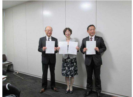
としま居住支援バンクに関する覚書締結式の様子

「としま居住支援バンク」の登録システムの開始にあたり、「宅地建物取引業協会豊島区支部」、「全日本不動産協会豊島文京支部」と「としま居住支援バンクに関する覚書」（令和4年10月17日）を締結した。