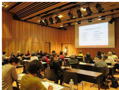
セミナーのようす