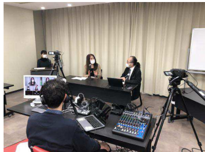
第4回特別企画セミナー オンラインセミナー の様子