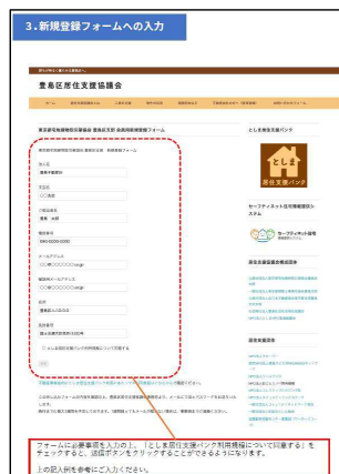
としま居住支援バンク不動産店向け新規登録マニュアル