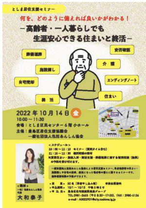
としま居住支援セミナーチラシ